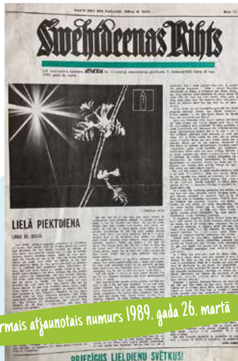
Pirmais atjaunotais numurs 1989. gada 26. martā

Atver saiti www.abone.lv vai zvani pa tālr. 67008001 vai 25008001, abonēt var arī "Latvijas Pasta" nodaļās un pie pastnieka. Abonēšanas indekss – 1095. Abonēšanas maksa 10 mēnešiem – 18,40.