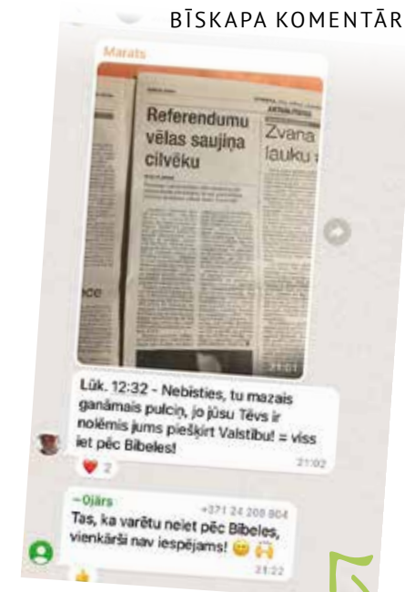
Tēvs ir nolēmis jums piešķirt Valstību!" (Lk 12:32) Un zīmīga šķiet sarakste kristīgo brāļu WhatsApp grupā – skatīt attēlu! ●

mācekļi, esot Ģenecaretas ezera vidū, piedzīvo vētru, viņi ir pārbijušies, šķiet, ka dzīvei pienācis gals, bet turpat laivā ir arī Jēzus, un tā ir mācekļu drošība. Dieva klātbūtne mūsu dzīvē dāvā drošību, un arī pretēji – bez Dieva parādās bailes. Kādi varēs sacīt – šodienas situācija nav saistāma ar balsošanu, jo no tā jau ģeopolitiski nekas nebūtu izmainījies. Zināmā mērā šinī apgalvojumā ir arī patiesība, situācija nebūs mainījies, lai gan mēs nezinām, kā ģeopolitiski Dievs būtu pavērsis situāciju, ja mēs tiktu līdz referendumam. Un, ja arī nekas nebūtu mainījies, mūsu tautas izvēle sekot grēkam vai no tā novērsties veido arī mūsu dvēseles stāvokli. Sekojot grēkam, arvien vairāk nokļūstam bailēs; paklausot Dievam, saņemam drosmi un spēku pārvarēt tās. Tamdēļ arī Jēzus mūs iedrošina: "Nebīsties, tu mazais ganāmais pulciņ, jo jūsu