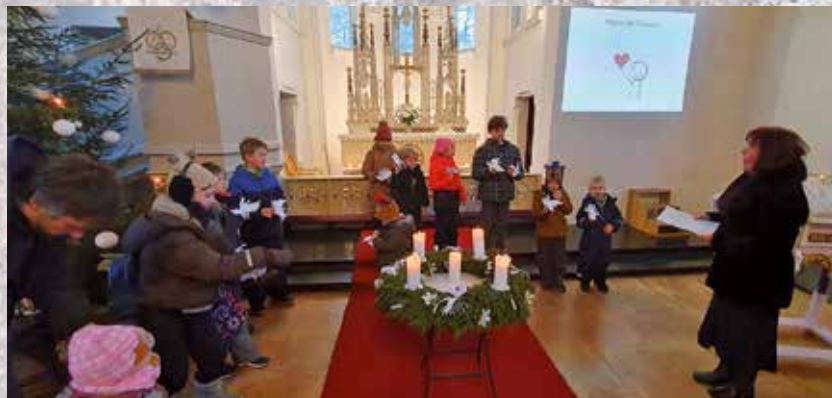
Ar Bulduru draudzes svētdienas skolas bērniem Ziemsvētkos.